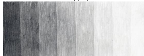
ПРИМЕР ТОНОВЫХ ГРАДАЦИЙ